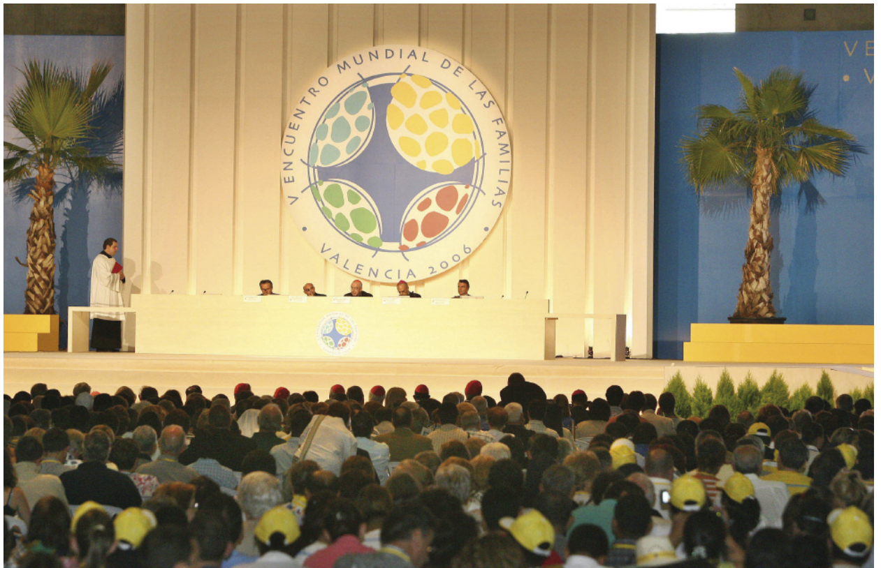
Convención durante la edición del Encuentro Mundial de las Familias en Valencia